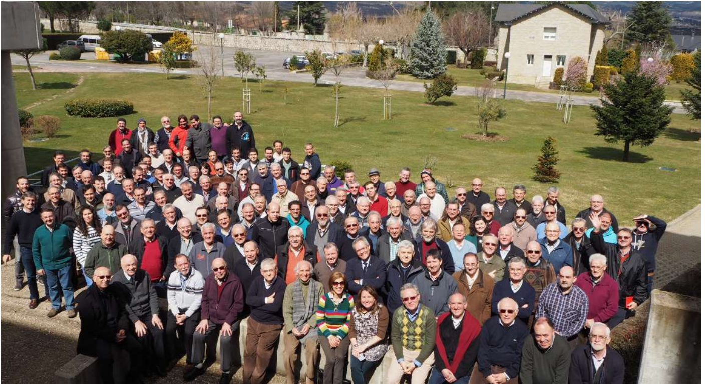
Participantes en el Capítulo Inspectorial 2016.