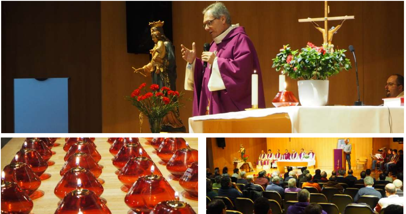
Celebración de la Eucaristía de clausura del CI16.