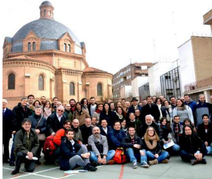
Estrecho, una de las casas donde se presentó el Cuadro de Referencia de la PJ Salesiana.

En el próximo mes de marzo, la delegación de Pastoral Juvenil organi-